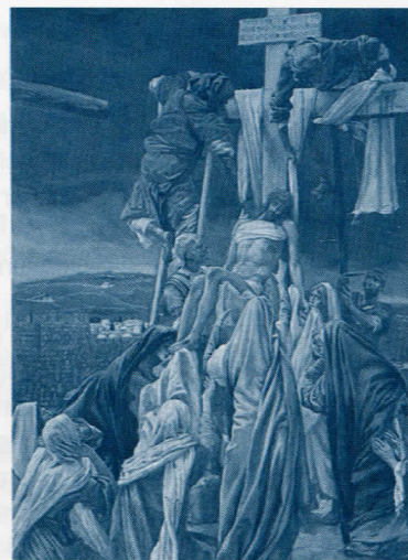
Kreuzabnahme (J.J. Tissot)